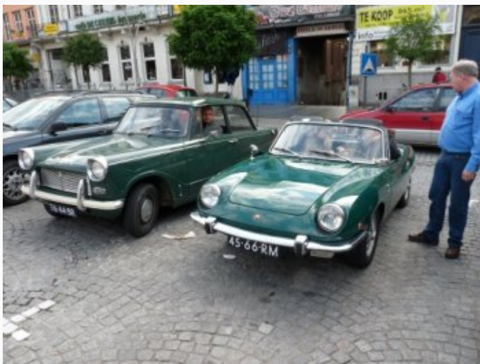
NAZARETH (17-18 okt.

2009) – Tijdens de najaarsrit op 18 oktober is een deel van de wielerklassieker Ronde van Vlaanderen gereden.