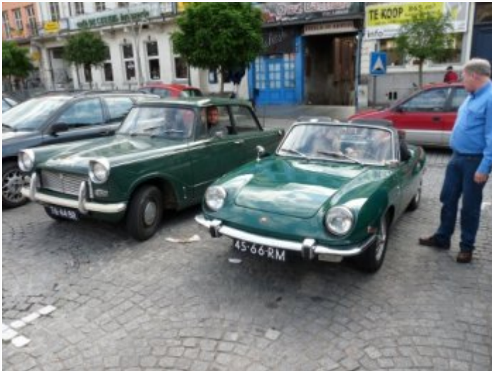
NAZARETH (17-18 okt.

2009) – Tijdens de najaarsrit op 18 oktober is een deel van de wielerklassieker Ronde van Vlaanderen gereden.