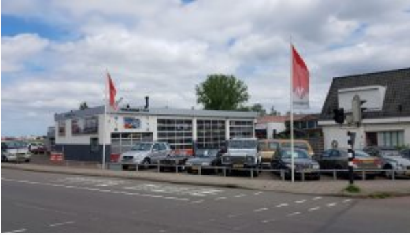
Oldtimers te zien

Op de route zul je in Leimuider de Vakgarage Tinga passeren. Je zult daar leuke oldtimers zien staan! Stap gerust even uit je auto en neem een kijkje.