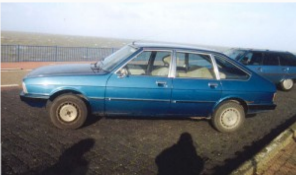
Chrysler Simca 1308GT exclusive uit 1978

HEEMSKERK (16 jan. 2011) – Het zal je maar gebeuren. Je rijdt samen met je moeder in een van je mooiste klassieker, in dit geval een Simca 1308GT. Je bent een eindje op weg en plots zie je een soort vluchtheuvel voor je opdoemen. Ineens is het knal!