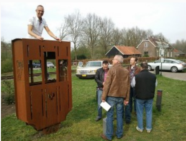
DEN BOSCH – De GCCC-

karavaan streek op zondag 3 april neer in de Meierij van 's-Hertogenbosch en omgeving. Met 92 deelnemers was het gezellig druk en de voorspelde regen bleef uit. We kregen zelfs de zon te zien en met 15 graden was het een heerlijke voorjaarsrit!