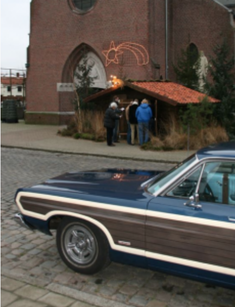
PUTTE-KAPELLEN (update 31 dec 2011)

– De 6e editie van de Kerststallenrit is verreden op woensdag 28 december 2011. Deze keer met 68 personen weer meer deelnemers dan op de vorige edities. Groot succes dus!