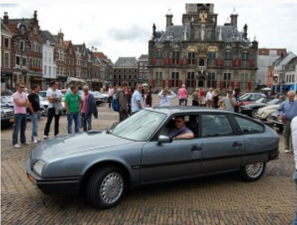
DELFT – De GCCC-

picknickrit van zondag 14 augustus startte 'poepie chique' op met mooie marktplein van Delft. Het was gezellig druk met 92