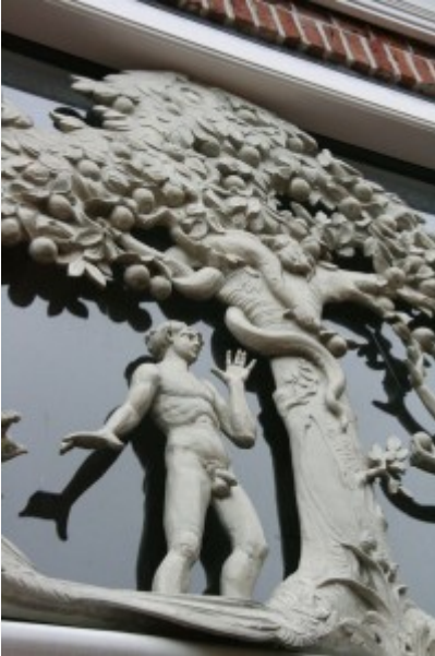
Historisch moment op de Orangerie

GRONINGEN – Op zaterdag 2 juli vond in Groningen de Roze Zaterdag plaats en de dag daarna verzorgde de GCCC een speciale Roze rit. Niet minder dan 37 leden van de GCCC waren met 15 introducés naar het hoge noorden gekomen om deze rit mee te rijden.