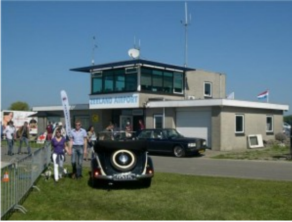
Zeeland Airport with oldtimers