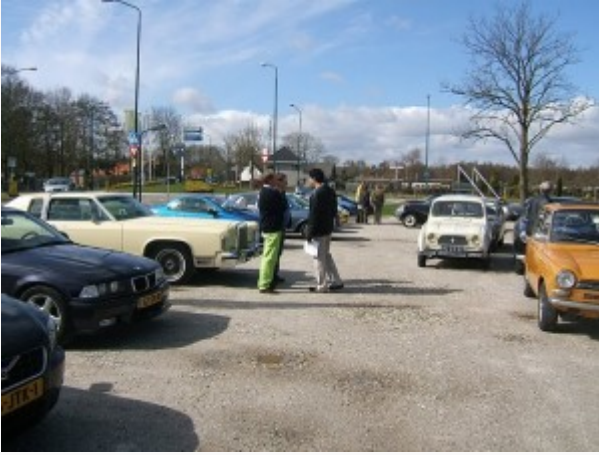
LOOSDRECHT (21 mrt. 2010)

– Bijna 90 deelnemers konden op zondag 21 maart genieten van een heerlijke zonnige voorjaarstocht langs drie B's: Burchten, Buitenplaatsen en Bastions. Een mooier begin van de lente konden we ons niet wensen.