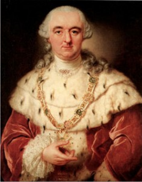
Laatste markies van Bergen op Zoom: Karel Philip Theodoor van Palts-Sulzbach (1728-1799)

De lenterit voerde ook door Wouw, één van de oudste plaatsen in het land van Breda. Vroeger was Wouw een aanzienlijk Leen van het hertogdom Brabant (1287 – 1795).