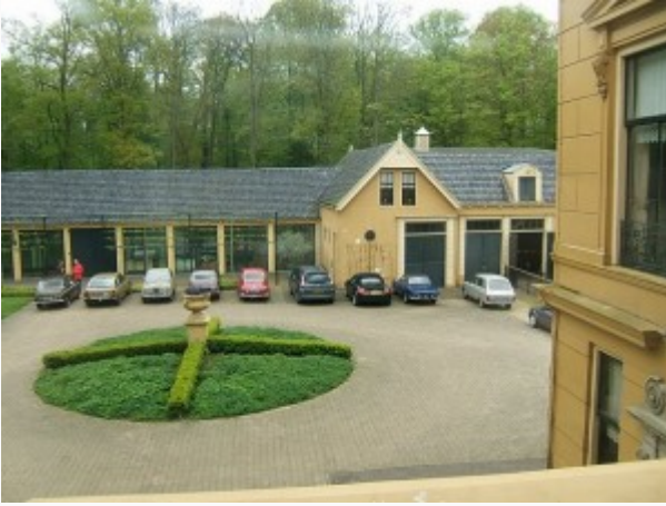
MIDWOLDE (9 mei 2010) –

GCCC-lid Freek organiseerde in het weekend van 8 en 9 mei een gezellige GCCC happening. Het evenement begon klein met 12 eters bij de BBQ van Jaap Stienstra op zaterdagavond. Op de dag van de GCCC-rit 'Scheef bij elk bochie, oh wat een lekker tochie' noteerden we 41 deelnemers.