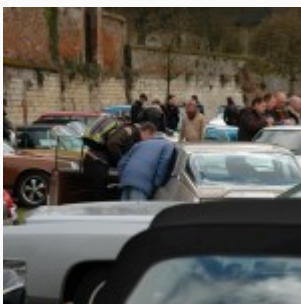
Happy Way 2010 near Amiens

AMIENS (April 6, 2010) – The 8th edition of the Happy Way at Easter was held in the northern region of France, the Somme near the city of Amiens. The general aim of the event remains having an interesting and entertaining weekend in a relaxing atmosphere, organised by Ledorga.