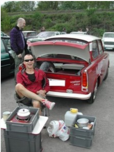
WUPPERTAL (1 mei 2010) – Een 14-tal

GCCC-leden deed mee aan de seizoensstart van zusterclub Queerlenker in Duitsland, een lekker voorjaarsweekendje 'Tussen de Rijn en de Ruhr' (30 april – 2 mei). De gastvrijheid van Queerlenker en het hotel Eskeshof was formidabel! We hebben ontdekt dat het Ruhrgebied ook hele mooie en vooral groene gebieden kent en ook veel cultuur te bieden heeft.