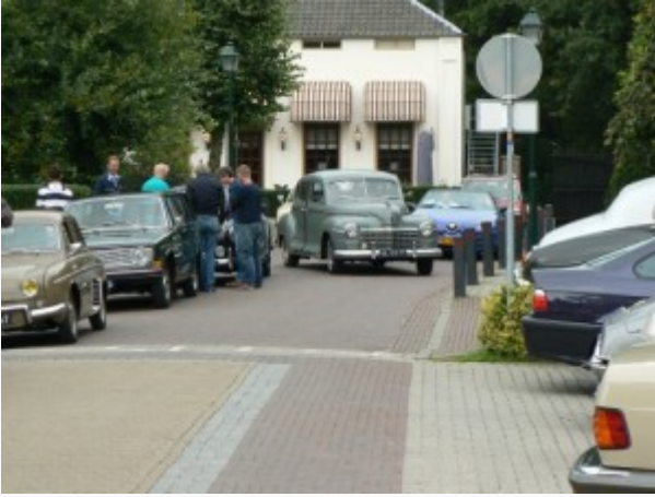
KERK AVEZAATH (19 sept

2010) – De najaarsrit van de GCCC met 76 deelnemers voerde dit maal door de Betuwe. Een schitterende rit door pittoreske dorpjes, nostalgisch Hollands landschap, uitgestrekte polders en mooie appel- en perenboomgaarden.