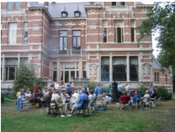
KAPELLEN (17 aug. 2003) –

Een mooie rondrit in de Belgische grensstreek van Kapellen met een afsluitende barbeque in kasteelachtige ambiance, vormden 17 augustus het decor van opnieuw een gezellig en geslaagd GCCC-evenement.